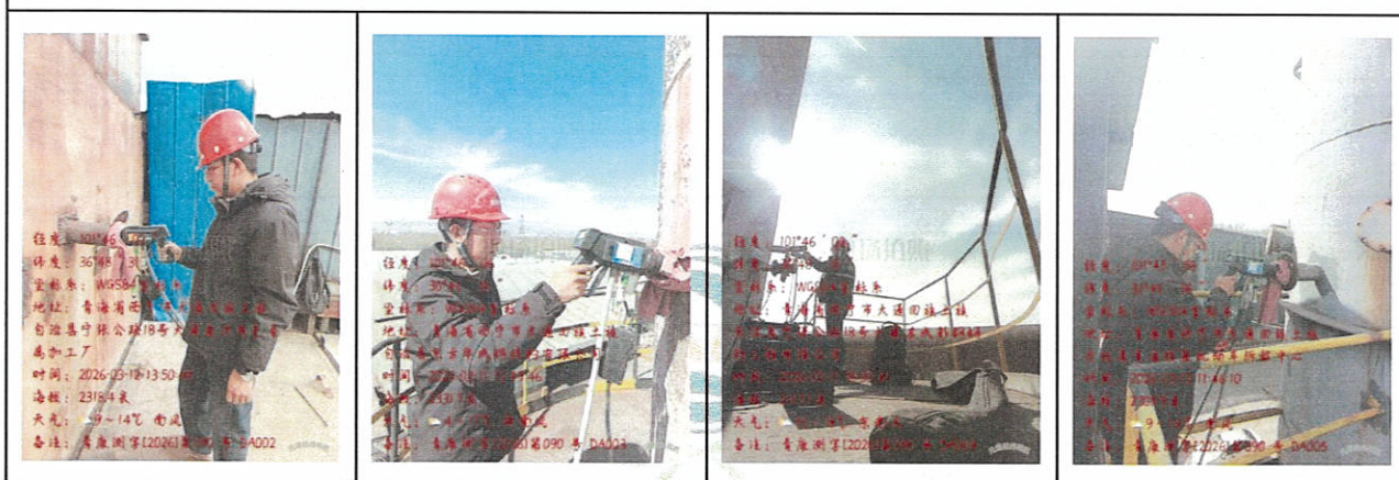
有组织废气现场采样照片