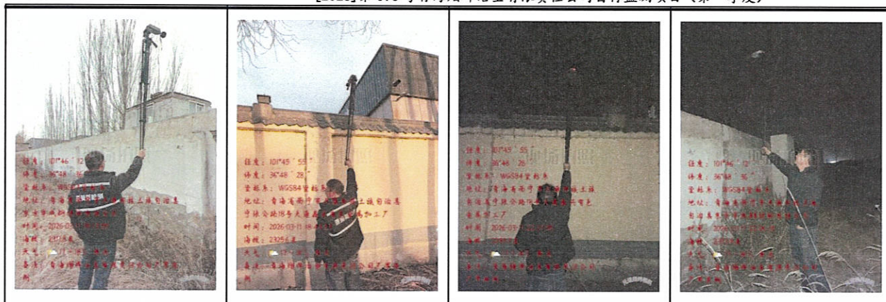
噪声现场采样照片